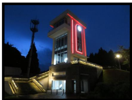
【むつ市】 展望台北の防人大湊海望館