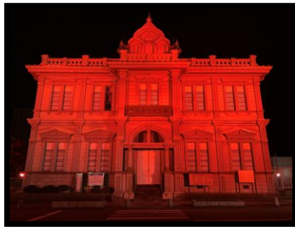
【弘前市】 旧第五十九銀行本店本館 (青森銀行記念館)